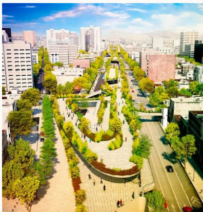
Corredores verdes urbanos pdf. Corredores verdes urbanos ejemplos.